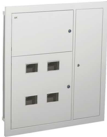
Щит этажный МКМ42-04-31-L