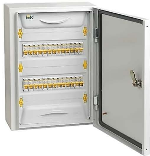
Щит квартирный типа ЯК

устанавливаются плавкие вставки или автоматические выключатели ВА47–29, ВА47–60, ВА88 или ВА44 IEK®.