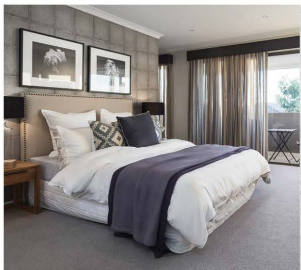
Электроустановочные изделия серии Bolero